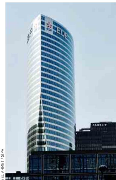
Le CE d'EDF avait été mis à l'index par la Cour des comptes en 2005 et 2007.

De fait, les comités d'entreprise ne sont soumis à aucune obligation de contrôle des comptes, soulignait hier le site d'information économique e24.fr. Tous les ans, les élus du CE doivent arrêter les comptes et les présenter au personnel. Mais il n'existe aucune règle de certification des comptes, ni contrôle officiel du budget. « Le commissaire aux comptes de la société n'a pas le droit d'y mettre son nez, et si beaucoup de comités font appel à des experts-comptables, ils n'y sont pas tenus par la loi », a expliqué au site Internet Frédéric